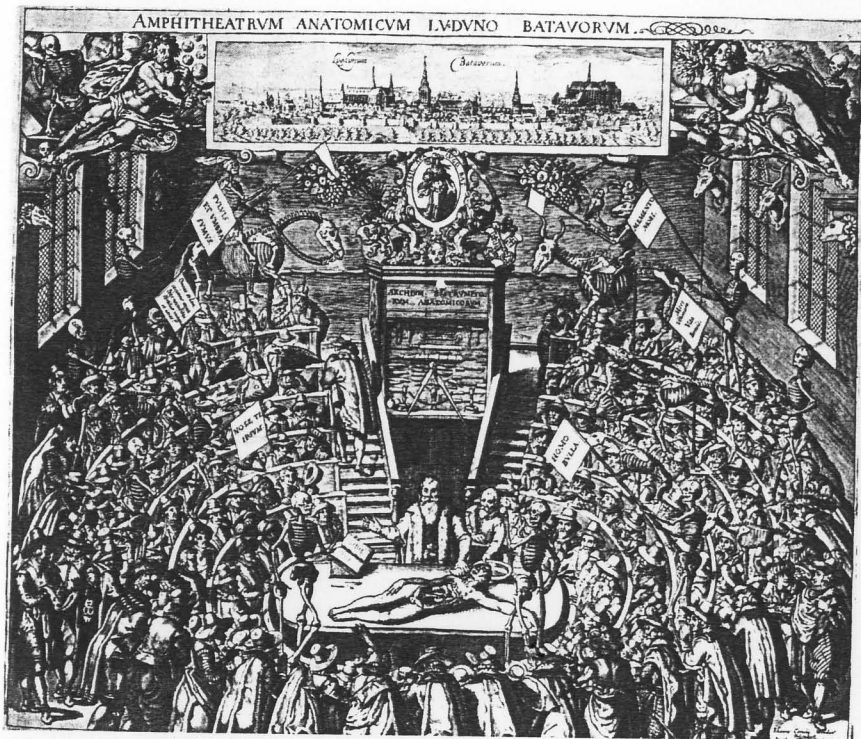
図5 ライデン大学解剖用劇場の木版画。1619

かのヨーロッパの大学でこういった解剖の公開劇場とそこで人々が浮かれ騒ぐことが常態であった例が確認されています。 なぜこのようなことになったのでしょうか。一つの答えは解剖が行われた時期に求めることができます。死体解剖は通常二月の寒い時期、死体が腐敗しにくい時に行われていました。そしてできるだけたくさんさんの学生を集め、大学側が儲けるために、大学の他の授業がないとき、つまり大学の休暇の時にやっていました。他の大学の学生も参加できるからです。それを満たすために、ちょうどヨーロッパのカーニヴァルの時期に公開解剖が行われることが多かったです。カーニヴァルは、ヨーロッパの祝祭の中でも最も複雑な雰囲気の人々が浮かれ騒ぐものだったので、その雰囲気も公開解剖にも影響したのです。死体解剖を見ながら楽しんで騒ぐ、あるいは狼狽な野次を飛ばす(女性の性器が解剖されるときは下品な野次が次々と聴衆から飛ばされました)という行為は、現在の我々からみると野蛮な行為に見えます。しかし、この解剖学をめぐる比較的知られていない事実が示唆している重要なことは、死体解剖は群衆を引きつけ