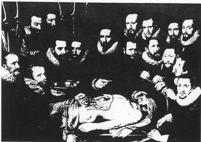
図2 ピーター・ファン・ミーレフェルト『ウィレム・ファン・デル・メーア博士の解剖学講義』(1617) デルフト, Oude en Nieuwe Gasthuis 蔵。