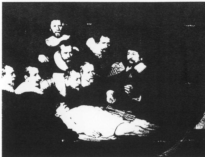
図1 レンブラント『ニコラース・テュルプ博士の解剖学講義』(1632) ハーグ市美術館蔵。

というと、答えはNOです。死体解剖は狭い意味での医学には限られないさまざまな機能を持ち、医学者のコミュニケーションを越えて伝えられる意味を持つていました。だからこそ、先にお話ししたような文化的コンセンサスも成立しえたといえます。